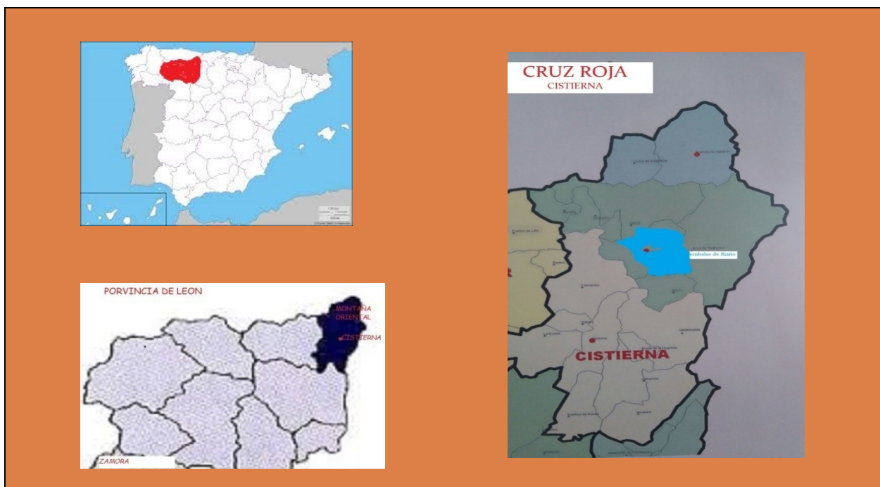
Figura 1. Mapa de Localización

La Asamblea Comarcal de Cistierna ejerce su influencia en 17 municipios con sus correspondientes localidades o pedanías. Y todos ellos pertenecen al Partido Judicial de Cistierna a excepción de Cubillas, Almanza y Cebanico, que lo son del de Sahagún.